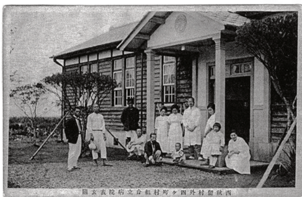
西後村外村組立合病院表表画